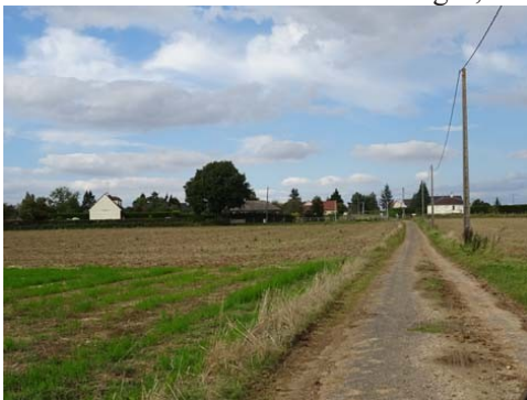
Vue de l'environnement immédiat

Les avis seront cohérents avec ceux émis ces derniers années, à savoir : pas de maisons à volume compliqué (type V, W, Y, ou Z), pentes à 45° pour les volumes principaux, ardoise ou tuile plate de teinte brun vieilli, à 20u/m 2 , avec un débord de toiture de 20cm, enduit de teinte beige clair avec modénatures (au choix : chaînages, encadrement de fenêtres, soubassement, colombage...). *Voir les autres fiches.