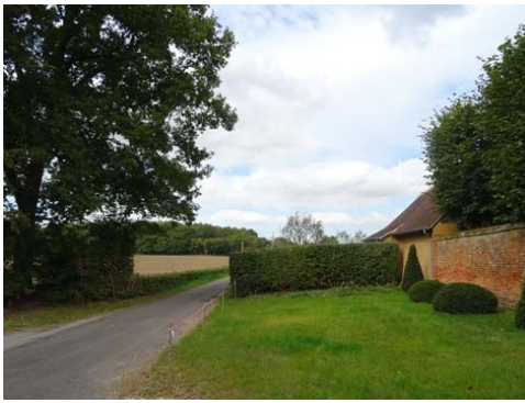
Vers le Nord