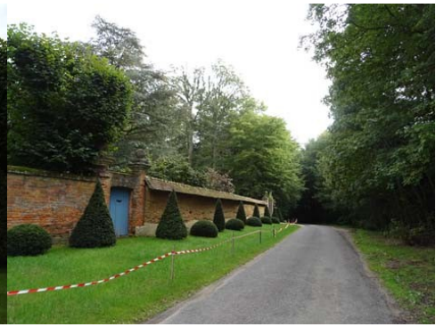
Vers le Sud