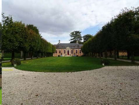
Le manoir de face