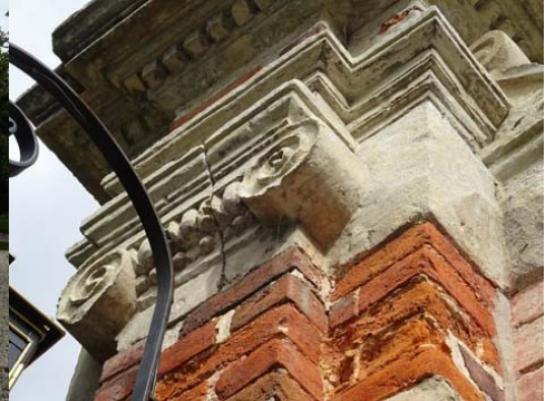
Détail de l'un des piliers