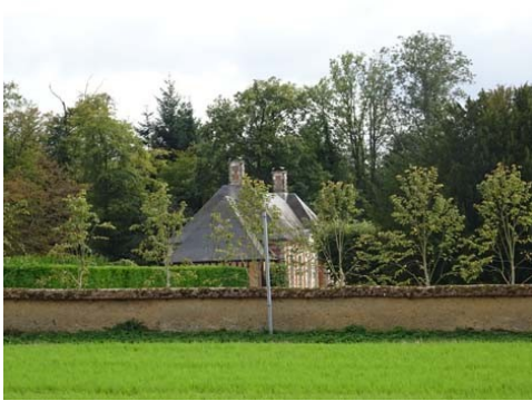
Le manoir de profil