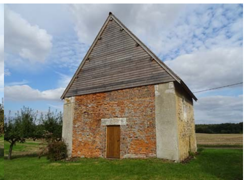
Ancienne chapelle Saint-Calais