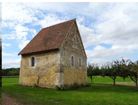
Ancienne chapelle Saint-Calais